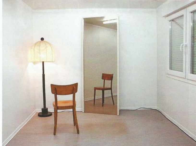
Le décor du «Triomphe de la renommée», joué partout dans le monde.

« Taxi-Dancers ». Théâtre de Vidy, Lausanne. Du 20 au 29 mai. (Loc. 021 619 45 45, www.vidy.ch ).